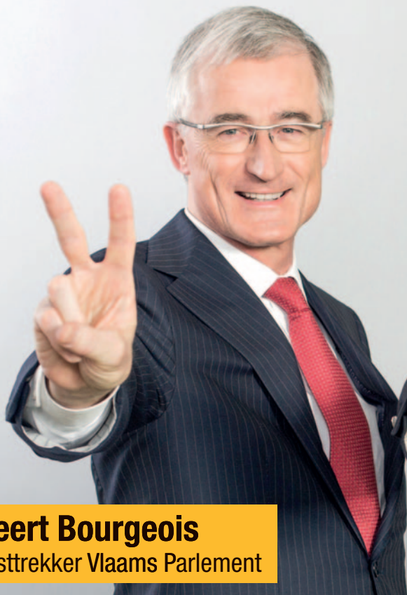
Geert Bourgeois Lijsttrekker Vlaams Parlement