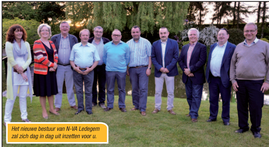
Het nieuwe bestuur van N-VA Ledegem zal zich dag in dag uit inzetten voor u.

Begin dit jaar verkozen we in Ledegem, net zoals overal in Vlaanderen, een nieuw bestuur voor onze afdeling. Heel wat leden daagden op om hun stem uit te brengen. Dat heeft ons zeer verheugd.